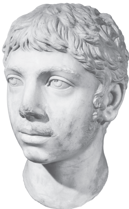
1. Heliogabalus márvány mellszobra. A tinédzser korú ifjú császárt hosszú pajesszal, leheletnyi bajusszal ábrázolták, és aligha tűnik olyan szörnyetegnek, amilyennek az uralkodásáról szóló irodalmi beszámolók alapján gondolnánk.

Köztudott volt róla, hogy soha nem viselte kétszer ugyanazt a cipőt (bizarr előképeként a Fülöp-szigetek egykori „first ladyjének”, Imelda Marcosnak, akinek állítólag több mint háromezer pár cipőt rejtett a gardróbja). Egyik perverz és költséges húzása volt, hogy nyáron a hegyekből származó hóval és jéggel töltötte föl a kertjeit, és csak akkor evett halat, ha sok mérföld távolságra volt a tengertől. Közben állítólag a vallási szokásokat megszegve feleségül vett egy Vesta-szüzet, a legfenségesebb római