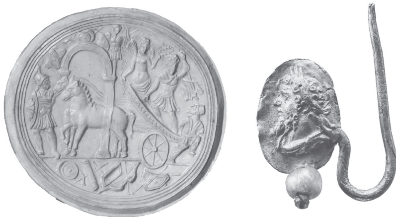
3–4. Két meglepő hely a császár képmásának. Balra egy ókori sütőforma replikája (valószínűleg vallási ünnepeken osztogatott aprósütemények készítéséhez), amelyen a császár látható a harci szekeren diadalmenetben, és a győzelem istennője koronázza meg (lásd a 12. képet is). Jobbra a császár arcma egy fülbevalón (az akasztó nyilván olyan szögben volt meghajlítva, hogy a portré nem fejjel lefelé lógott).

A császárok közvetlen környezete is nyitott könyv előttünk. Körbesétálhatjuk a palotáikat, nem csupán a Róma központjában álló Palatinus-dombon állókat (innen ered maga a „palota” szó), hanem a külvárosi mulatókertjeiket és a városon kívül lévő rezidenciáikat is. Az egyik, Hadrianus császár villája nagyjából 30 kilométerre Rómától, Tivoliban áll. Az egész a parkjaival, lakóépületeivel, rengeteg étkezőjével és könyvtáraival csaknem kétszer akkora, mint az ókori Pompeji. A „villa” erősen visszafogott kifejezés erre a komplexumra, sokkal inkább olyan, mintha egy magánváros lenne. És farkasszemet nézhetünk a császárok portréival is.